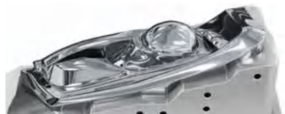
用于生产汽车前大灯的高度抛光模具。

以下机械性能是指样品取自尺寸为596×296mm的板料中心部位，有附加说明除外。机械性能取决于原大料的尺寸、取样位置、方向以及硬度和测试温度。